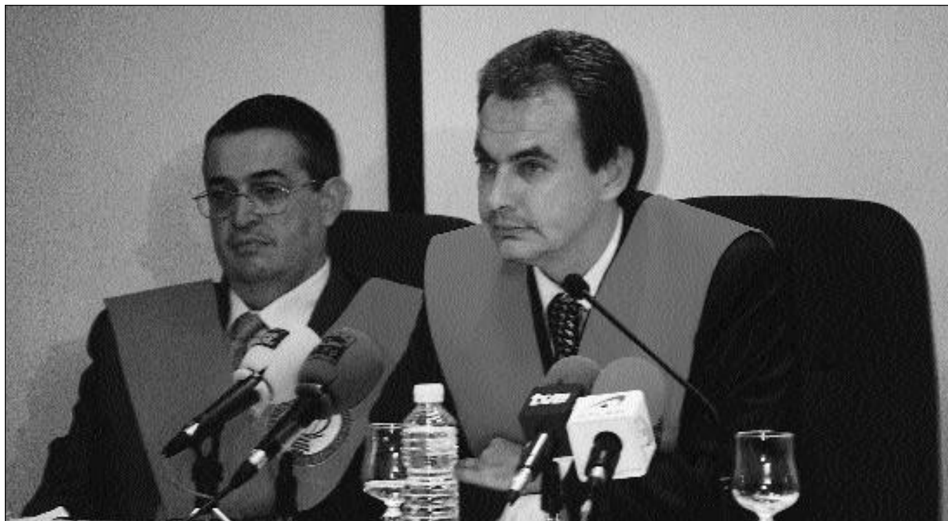
El Secretario General del PSOE, José Luis Rodríguez Zapatero.

El Secretario General del PSOE, José Luis Rodríguez Zapatero, expuso el 16 de octubre sus ideas sobre la política, considerada desde un punto de vista elevado, en el que los ciudadanos no sólo están invitados a participar, sino también a crear. Con sus palabras, se inauguró el curso en la Residencia “Antonio Machado”.