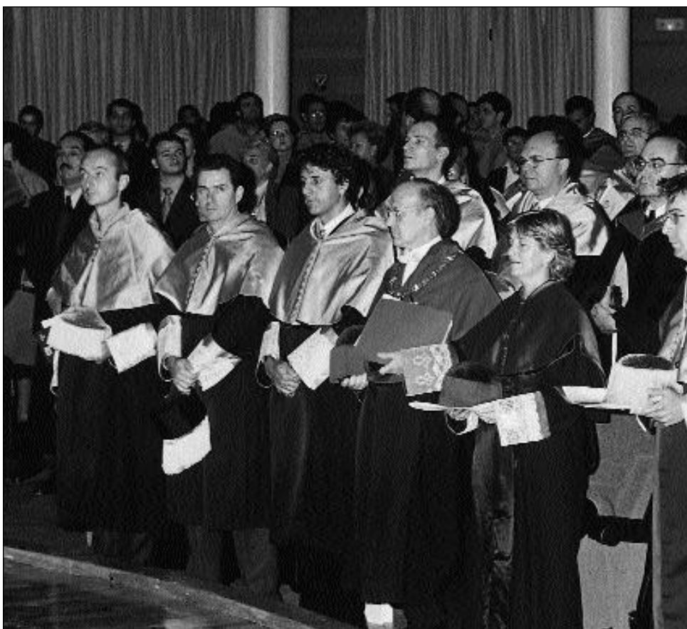
El Aula Magna, en el día de la Apertura de Curso, el pasado 5 de octubre.

También relató a la comunidad universitaria la trayectoria intelectual y de historiador del profesor Chartier: sus primeras investigaciones en los años setenta, sobre las formas de sociabilidad y la Historia de la Educación, sus aportaciones fundamen-