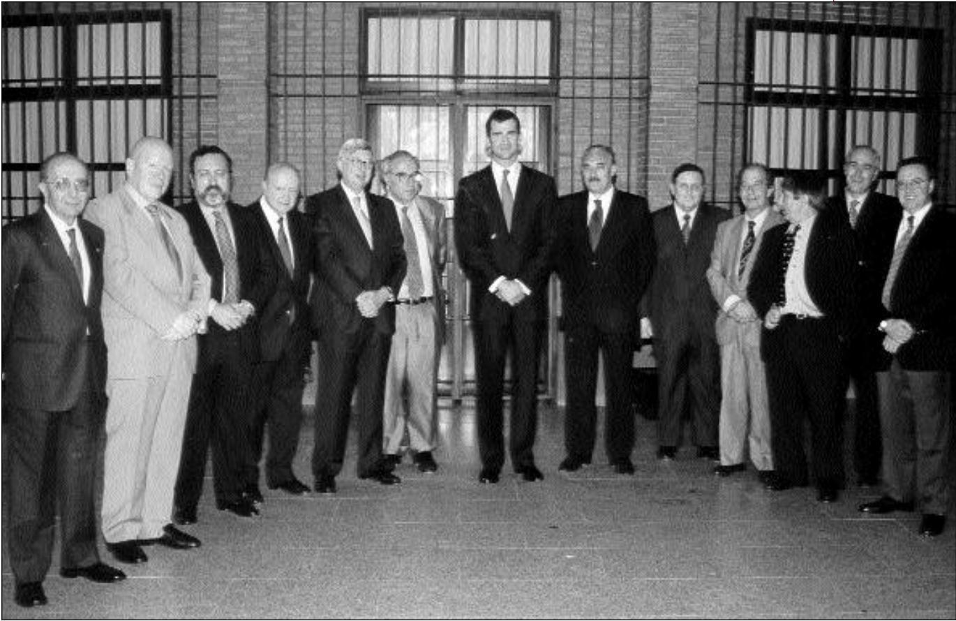
Arriba, con los Rectores de las universidades madrileñas. Debajo, Don Felipe acompañado del Rector y del Presidente de la Comunidad.