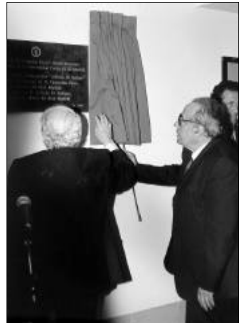
Di Stefano descubre la placa de ingua

Tras el acto en el Polideportivo, Di Stefano, el Rector y el resto de autoridades se acercaron a la Residencia de Estudiantes “Fernando de los Ríos”, donde recibió la Beca de Honor de este centro.